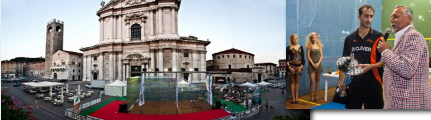
Il campione Simon Rosner, vincitore dell'International Squash Stars 2010