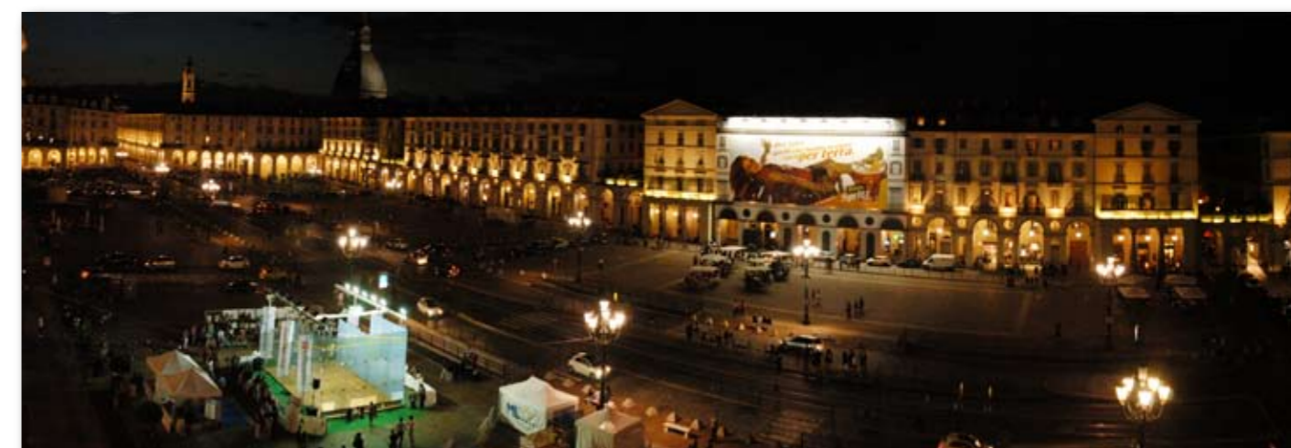
Il Glass Arena, unico campo da squash in vetro in Italia, installato in Piazza Vittorio Veneto a Torino.

* i dati statistici sono aggiornati a Giugno 2010